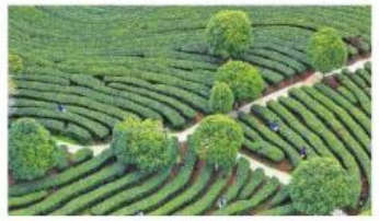
为山村烈士寻亲获重大进展

【新华社北京2月18日电】党的十八大以来，以习近平同志为核心的党中央团结带领全党全国各族人民，自信自强、守正创新，顶住百年未有之大变局的冲击，统筹疫情防控和经济社会发展，在危机中育先机、于变局中开新局，推动我国经济实力、科技实力、综合国力跃上新台阶，人民生活持续改善，改革开放和社会主义现代化建设取得新的重大成就，党和国家事业取得历史性成就、发生历史性变革，我国发展取得举世瞩目的伟大成就，为全面建设社会主义现代化国家、全面推进中华民族伟大复兴奠定了坚实基础。